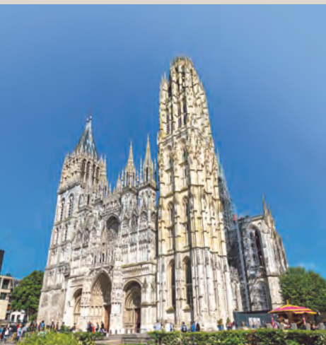
La cathédrale Notre-Dame de Rouen