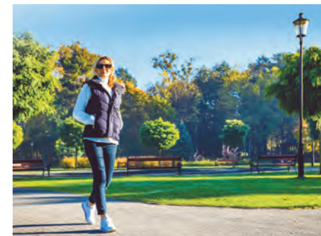
Promenade au Jardin des Plantes ou au Parc des Bruyères