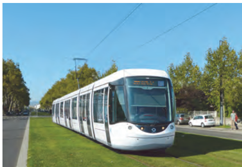
Le "métrô sur gazon"