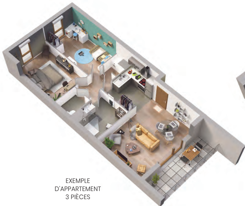
EXEMPLE D'APPARTEMENT 3 PIÈCES