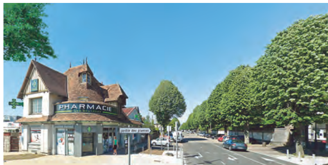
L'avenue des Canadiens