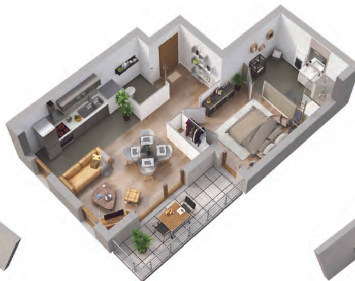
EXEMPLE D'APPARTEMENT 2 PIÈCES