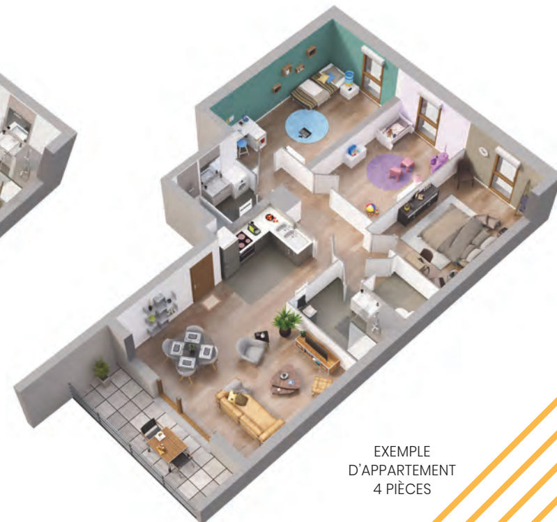
EXEMPLE D'APPARTEMENT 4 PIÈCES