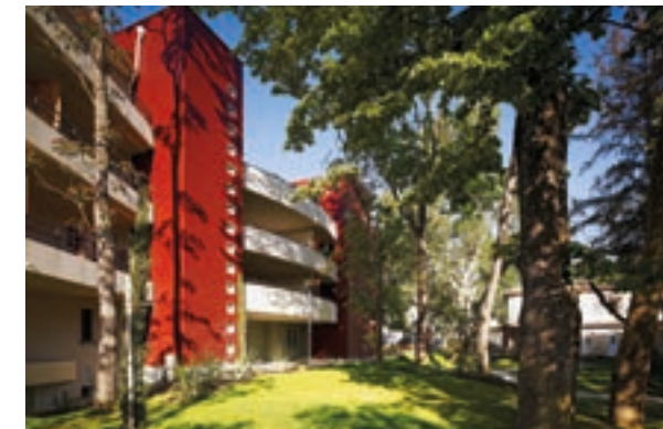
Les Jardins du Golf - Toulouse Architecte Ryckwaert