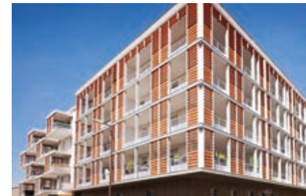
Magellan - Toulouse Architecte Sutter - Taillander