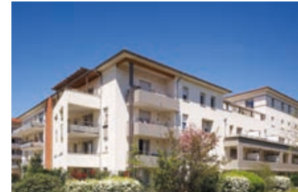
Cassiopée - Colomiers Architecte Martinie