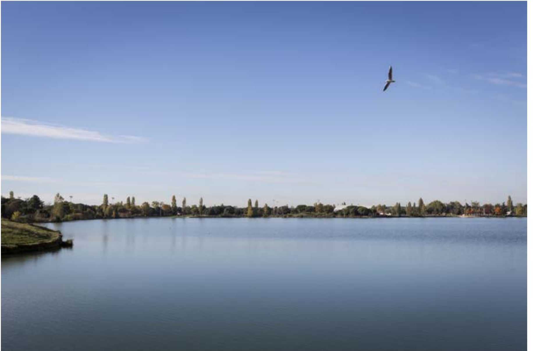
Cugnaux, une commune riche en patrimoine architectural et paysager